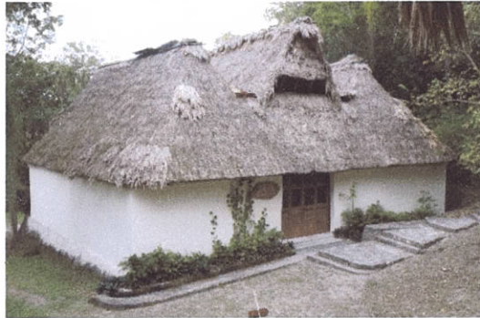
Figura 2. Museo de sitio de Yaxha