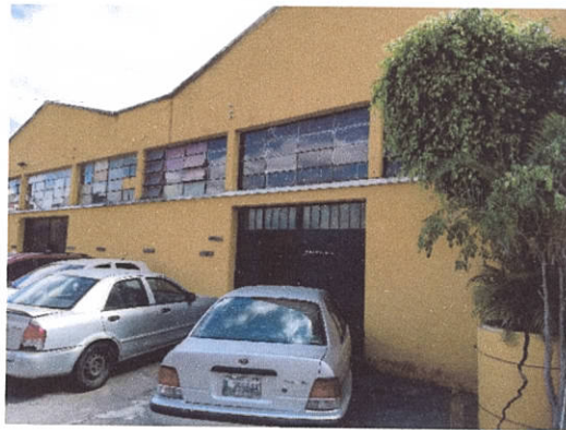
Figura 8. Fachada del área que ocupa la Ceramoteca