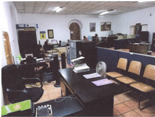
Figura 3. Área administrativa, DEMOPRE