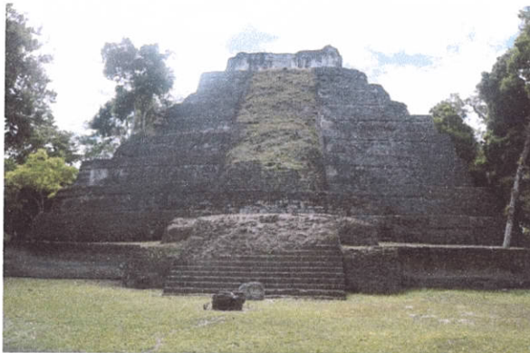
Figura 5. Edificio 216 de Yaxha, donde se propuso la instalación de un deck en su cima y la renovación de la escalinata de madera ubicada en su fachada norte